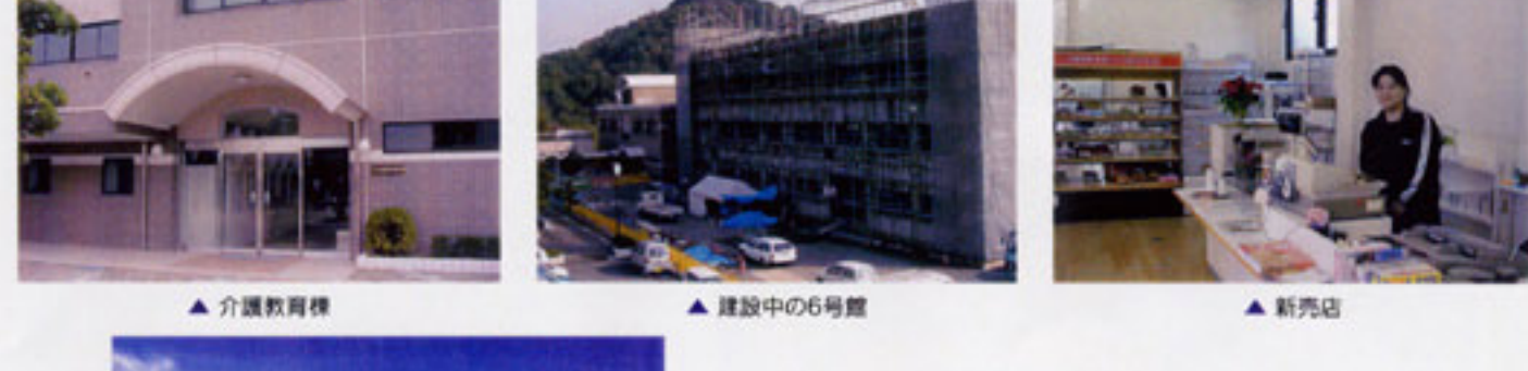
▲ 介護教育棟 ▲ 建設中の6号館 ▲ 新売店

卒業生の皆さんもご自身の目で、我が母校の新たな発展を是非一度ご覧になって見ませんか?